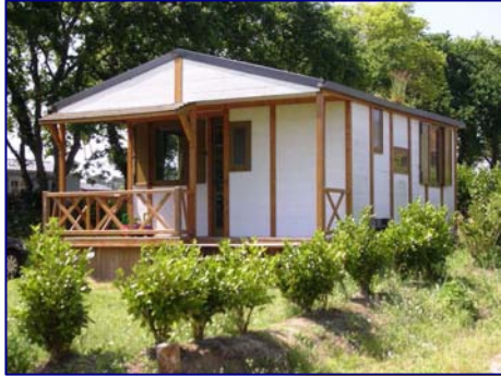
CHALET 5 PLACES