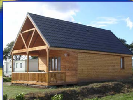
CHALET 4 PLACES