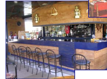
BAR « LE WILLOW »