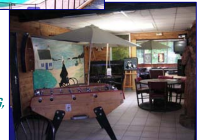
SALLE DE JEUX ET SALLE TV