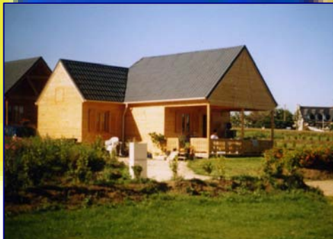
CHALET 6 PLACES