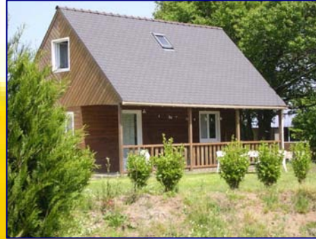
CHALET 6 PLACES